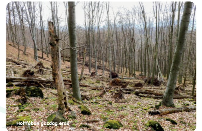
Holtfában gazdag erdő