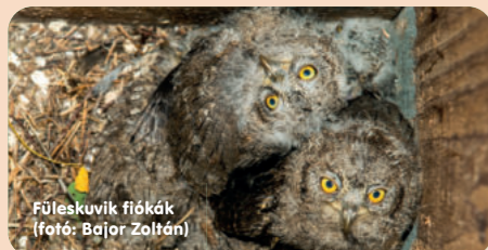
Füleskuvik fiókák